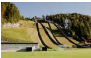
Nord. Sport & Besichtigung WM-Arena und vieles mehr ...