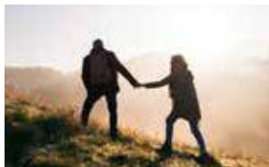
Sonnenaufgangstour auf den Gschwandtkopf